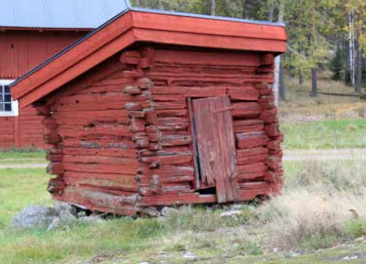
Bild första sidan: Klockboden, Gårdeby Bild ovan: Dass, Ramshultstorp, Börrum. Nedan: Uthus Korsnäs g:a prästgård, S:t Anna.